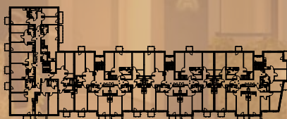
klatka B1 klatka C1 klatka C2 klatka C3