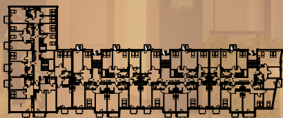
klatka B1 klatka C1 klatka C2 klatka C3