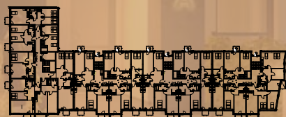
klatka B1 klatka C1 klatka C2 klatka C3