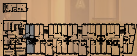
klatka B1 klatka C1 klatka C2 klatka C3