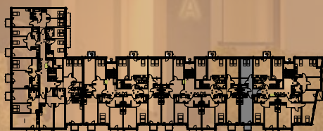
klatka B1 klatka C1 klatka C2 klatka C3